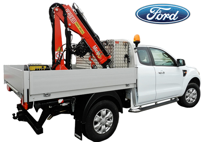
Pumpservicebil Ford Ranger med Fassi M15

Vanligaste förekommande Ford-modellen är Ford Ranger RAP Cab (Rear Access Panel, fyra dörrars kupéstil med bakdörrar). Kranar kan förstås även monteras på andra modeller av Ford Ranger.