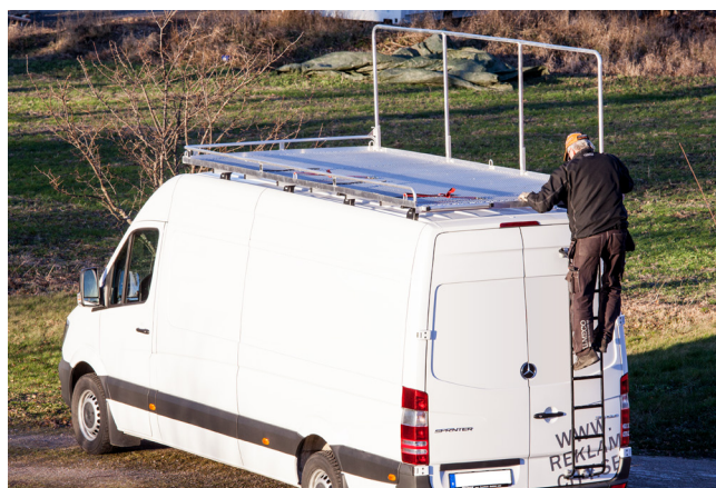
MB Sprinter med plattform 1,8x 4 meter och tillvalet skyddsräcke.