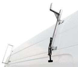
Tillvalet steghållare sidohängd.