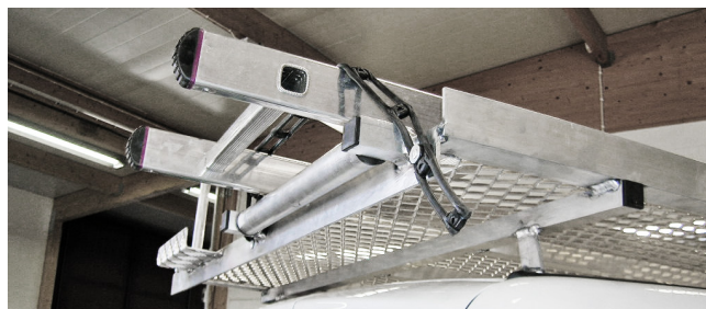
Tillvalet steghållare ovanpå plattformen med lastrulle i bakkant.

Almeco har till exempel byggt en stor del av de specifika plattformarna som syns på Relacoms bilar. Ett annat kundsegment som använder våra plattformar är fastighetserviceföretag och skyltföretag som behöver komma upp på fasader.