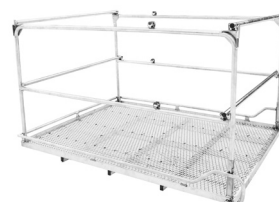
Tillval skyddsräcke Finns i 2 varianter. Fällbart framåt eller fällbart inåt.